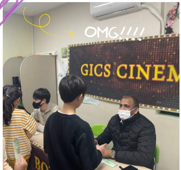
아이들이 너무 좋아해요!