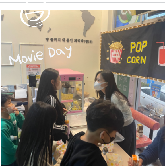
재미있는 프로그램도 너무 많아!