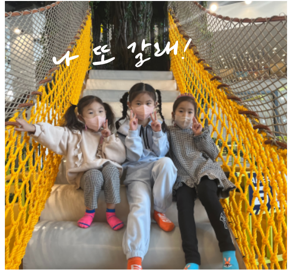
너무 행복했어요! 너무너무!