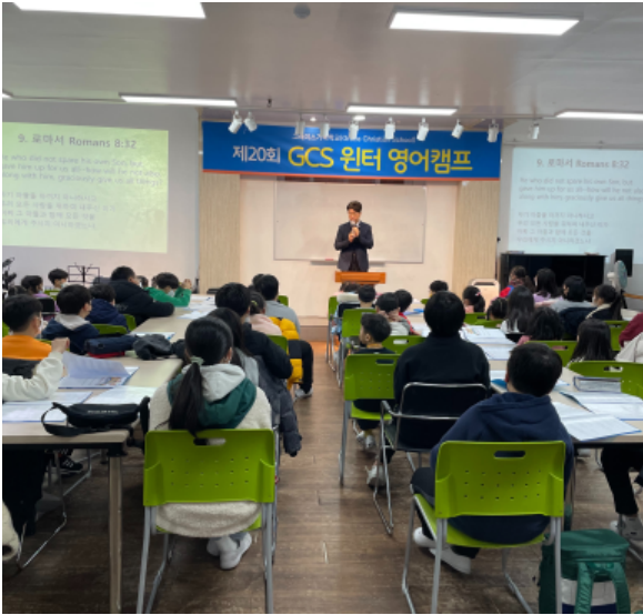
이런 유익한 캠프는 처음!